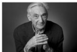
Howard Zinn Un inlassable optimisme