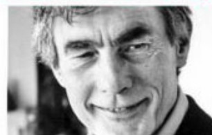
Theodore Roszak et les écopsychologues Nous reconnecter à la nature sauvage