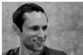
Charles Eisenstein Un monde d'abondance magnifique