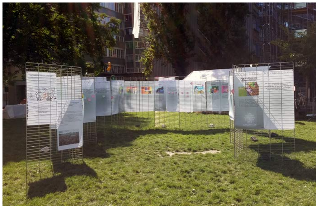
De l'égo à l'éco, ou qu'est-ce que la Transition intérieure ? un dispositif en 12 thèmes

Presse GE Protège l'environnement en adaptant rpages de Greenpeace à l'échelle locale dans le t des valeurs, de non-violence et d'indépendance aires et politiques.