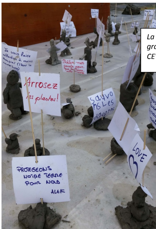
La MégaMiniManif, création collective avec de l'argile gracieusement livrée par une entreprise du chantier du CEVA

Créez un petit personnage (ou un groupe de...) qui tient une pancarte ou une banderole avec votre revendication ou demande adressée - à vous-même, ou - aux autres, ou - aux autorités pour sauver le climat et construire un monde meilleur et plus juste.