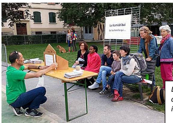
Le Kamishibai de la Chenille qui avait presque oublié de devenir un papillon, ou la Transition intérieure racontée aux petits.