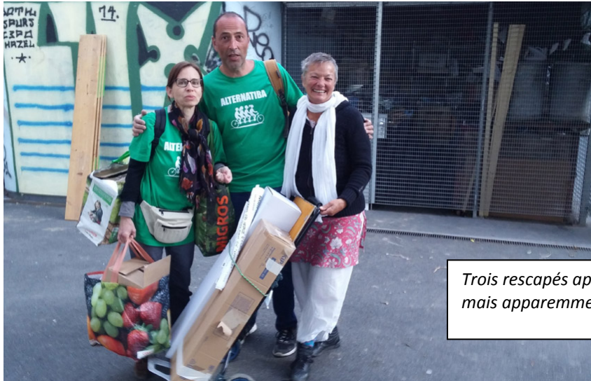
Trois rescapés après la fin des rangements, fatigués, mais apparemment, heureux !

Nous remercions également l'équipe de bénévoles qui n'a pas ménagé ses efforts pour soutenir l'installation, l'animation et le rangement des dispositifs avant, pendant et à la fin de l'événement.